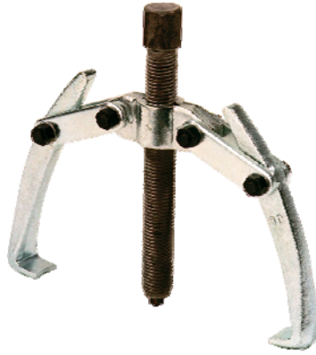
Extracteur à bras articulés (en 2 et 3 bras)