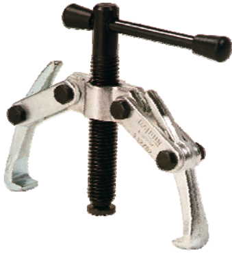
Extracteur à bras articulés (en 2 et 3 bras)